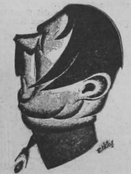
Herr HITLER a quien asustan las predicciones astrológicas.

depósitos de municiones, en tanto que los rusos han reanudado sus ataques aéreos contra esta capital y otras muchas poblaciones. Dos alarmas aéreas fueron dadas esta mañana aquí, apareciendo sobre la ciudad seis aviones enemigos, los cuales fueron rápidamente rechazados por las baterías anti-aéreas. E nel frente de Ladoga la explosión de una bomba soviética hirió en un brazo al voluntario norteamericano. (PASA a la página OCHO)