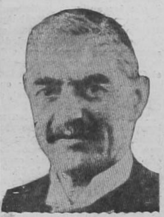
CHAMBERLAIN, cuya residencia fue objeto de un atentado.

AGENTES DE LA POLICIA ARMADOS DE RIFLES GUARDAN LA LEGACION CON ORDEN DE IMPEDIR EL TRAFICO DE PASAPORTES FRANCESES PARA LOS REFUGIADOS CHECOS